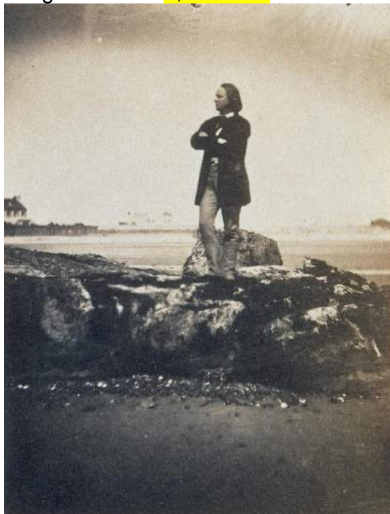
Victor Hugo sur la grève d'Azette (lors de son exil sur l'île de Jersey, 1852-1853)

Le célèbre poète Victor Hugo mesurait 1,68 mètre .