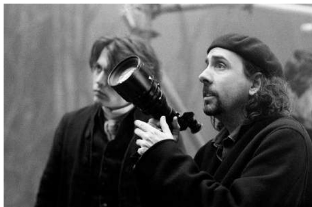
Johnny Depp (second plan) et Tim Burton sur le tournage de Sleepy Hollow, la légende du cavalier sans tête (1999)