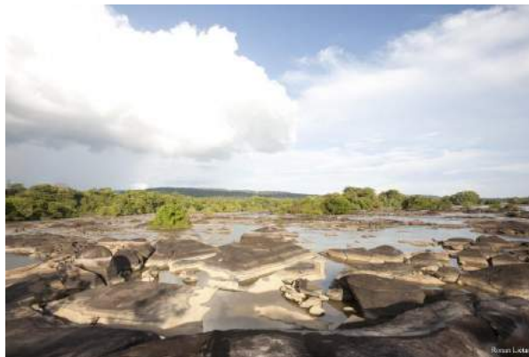
Parc amazonien de Guyane

Partez à la découverte des 11 parcs nationaux de France grâce à leur site, très bien illustré et documenté : http://www.parcsnationaux.fr/fr